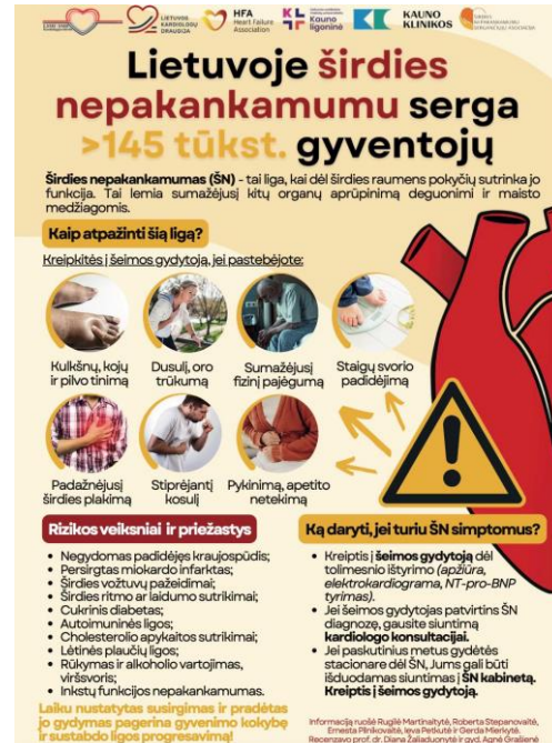
poster for patients