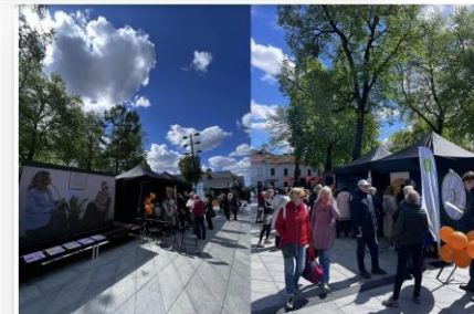
Gegužės 2 d. 12-15 val. Kaune, Laisvės atėjoje ties Miesto sodu ir R. Kalantos paminklu vyks renginys Tarptautinei širdies nepakankamumo dienai paminėti, rašoma LSMU Kauno ligoninės pranešime.